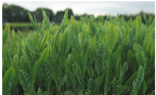
写真；「ゆめかおり」の新芽